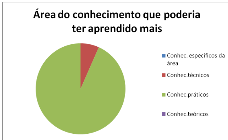
Figura 2: Área do conhecimento que poderia ter aprendido mais